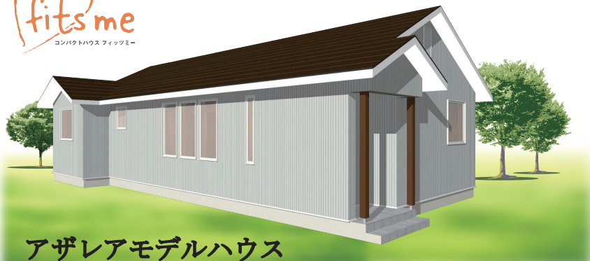
アザレアモデルハウス