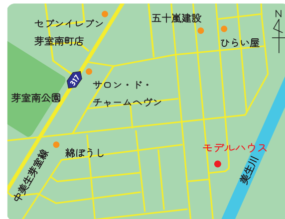
～駐車や車の来りやすい三方道路～